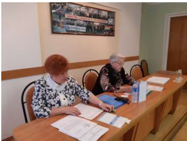
ЗАСЕДАНИЕ ОБЛАСТНОГО ПРЕЗИДИУМА

Рассмотрены вопросы финансового состояния областной организации, о выполнении территориальных Соглашений Малоарославцевкой, Держинской районных организаций и Обнинской, Калужской городских организаций Профсоюза, о состоянии охраны труда в образовательных организациях Жуковского района», об итогах поддержки мобилизованных и участников СВО и членов их семей и др..