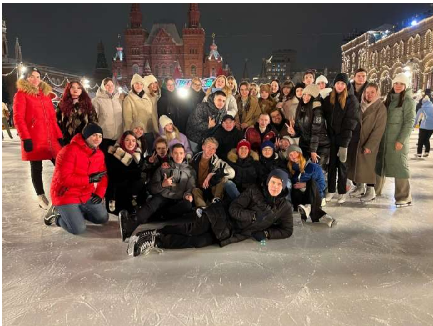
Довольные студенты на ГУМ-катке

Первичные профсоюзные организации студентов КГУ им. К. Э. Циолковского и КФ МГТУ им. Н. Э. Баумана были поощрены областной организацией Профсоюза поездкой в г.Москву, побывали на ГУМ – катке, получив незабываемые эмоции и положительные впечатления.