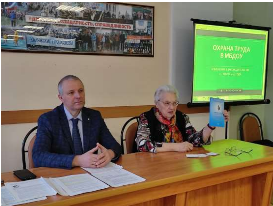
ОБУЧЕНИЕ ПО ОХРАНЕ ТРУДА

В течение года продолжалось обучение специалистов по охране труда. 115 человек прошли обучение по заявкам общеобразовательных организаций г. Обнинска, Дзержинского и Малоярославецкого районов.