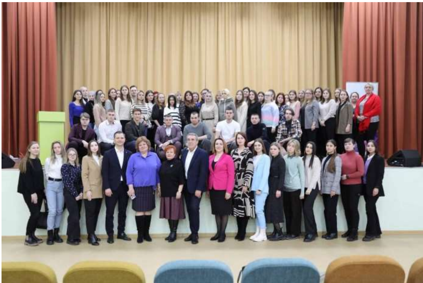
Участники Форума молодых педагогов в г.Малоярославце