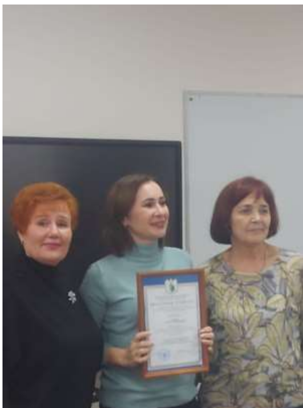
СЕМИНАР В БОРОВСКЕ

Состоялись выездные совещания «О выполнении коллективных договоров в образовательных организациях» Боровского, Перемышльского и Хвастовичского районов.