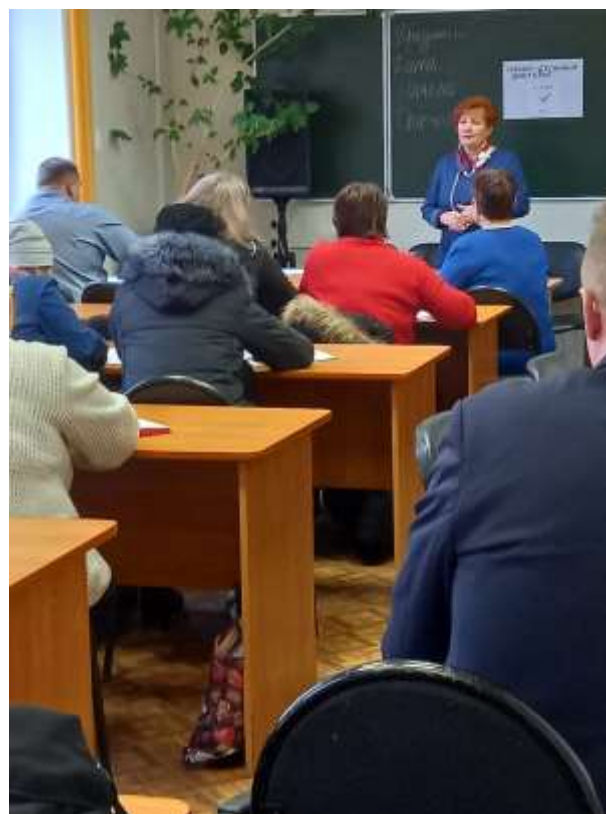
СЕМИНАР В ХВАСТОВИЧАХ